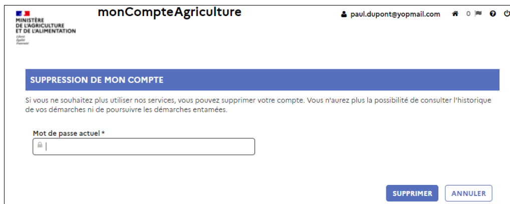
Figure 3. Suppression d'un compte Agriculture

4. La page de suppression de monCompteAgriculture s'affiche (cf figure 3)