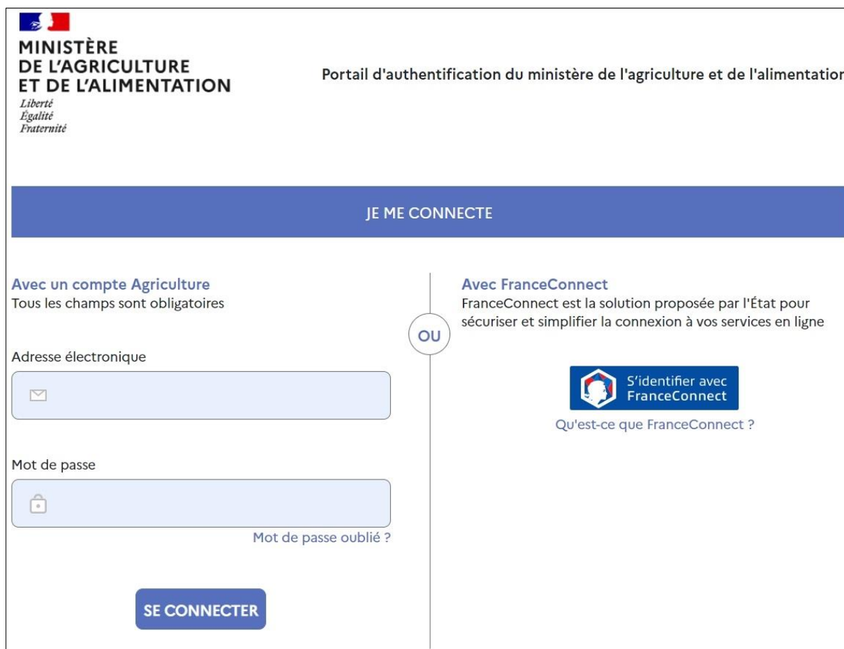
Figure 1 Portail d'authentification du ministère de l'agriculture et de l'alimentation