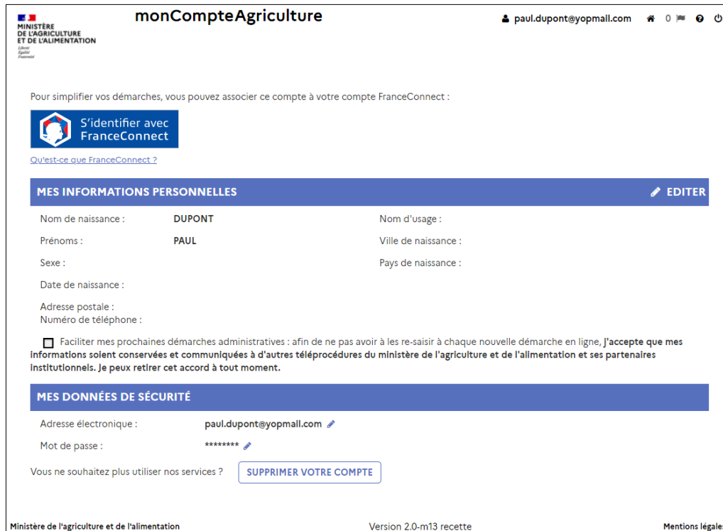
Figure 2. Gestion de monCompteAgriculture

4. La page de suppression de monCompteAgriculture s'affiche (cf figure 3). Saisissez votre mot de passe et cliquez sur SUPPRIMER